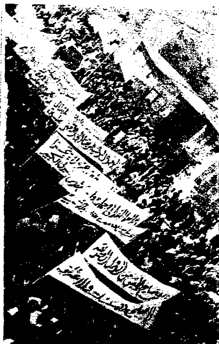
جلبت من المسيرة التمهيلة التي نظمت في اربد امس